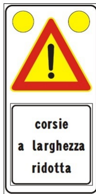
Figura II 391c Art. 31