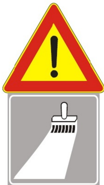
Figura II 391 Art. 31